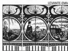
Azulejos modernistas Salón principal El zócalo tiene escenas alegóricas a la agricultura, la industria y las Bellas Artes se encuentran en el salón principal. Se van a cuidar con sumo esmero.

El emblemático edificio de Quart de Poblet está en pleno proceso de renovación. Se mantendrán y respetarán la fachada, las vigas de madera del teatro original y el zócalo modernista del salón principal