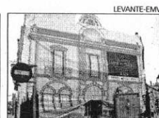
Fachada cubierta La estructura Al empezar las obras se ha protegido con una lona la fachada del Casino. Las tejas de la parte superior se han quitado para poder seguir el trabajo con seguridad.