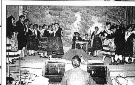
BAILES Y REPRESENTACIONES