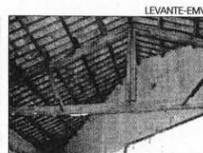
Vigas de madera Teatro original Es uno de los pocos elementos del edificio que perdura en muy buen estado con el paso de los años. Se va a conservar mediante una rehabilitación muy cuidada.